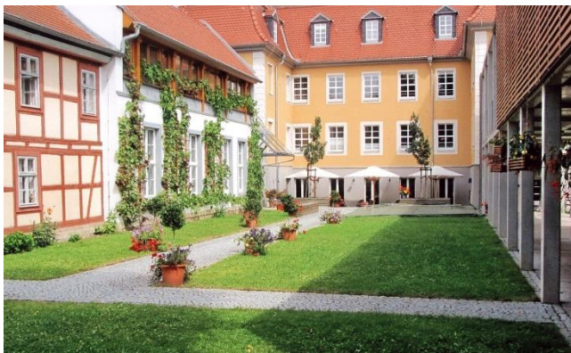
Der Innenhof des Zinzendorfhauses in Neudietendorf